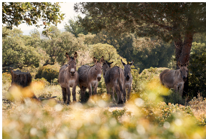
CLOS MIREILLE - CRU CLASSÉ DE PROVENCE

Le domaine donne naissance à un blanc et un rosé, des cuvées fraîches et épanouies, sur le fruit et la tension, au léger accent salin.